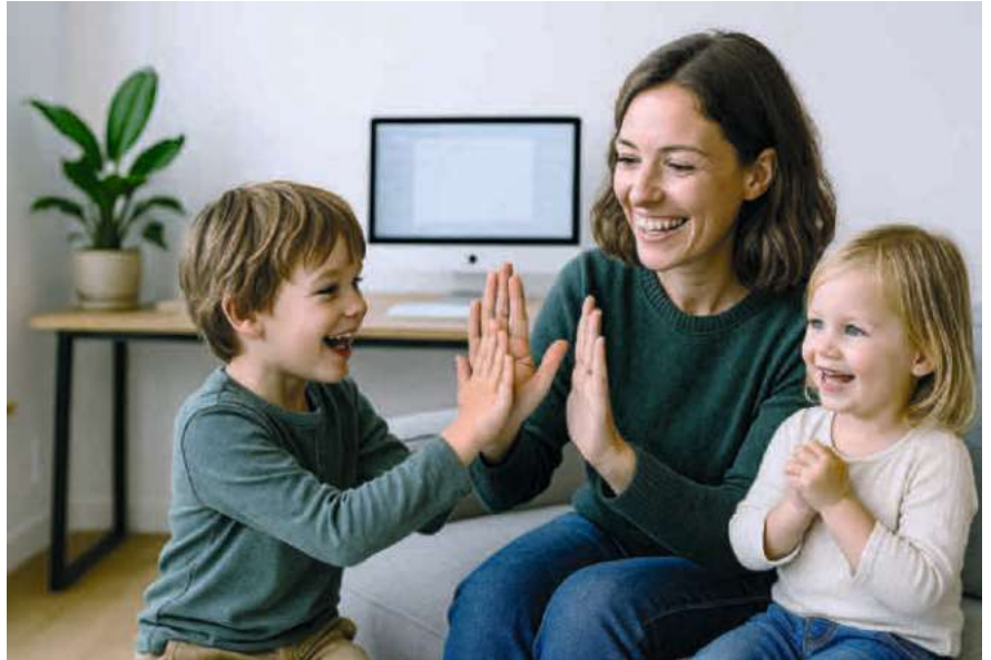
Bei Teilzeit sollten Paare und Familien ihre soziale Absicherung sorgfältig analysieren.

Dem Risiko bei Todesfall sollte man als Familie oder Paar (verheiratet, eingetragene) ebenfalls Aufmerksamkeit schenken. Hier steht die finanzielle Situation der Hinterbliebenen im Fokus. Bei einem Unfalltod greifen die Leistungen von AHV und Unfallversicherung, die – mittels Witwen- oder Witwerrente – zusammen bis zu 90 Prozent des entgangenen Lohn-Einkommens der verstorbenen Person decken und so den Einkommensverlust ein Stück weit kompensieren. Bei einem krankheitsbedingten Todesfall fällt die finanzielle Absicherung für die Hinterbliebenen deutlich tiefer aus. Wo Teilzeitpensen im Spiel sind, ist es als Familie oder